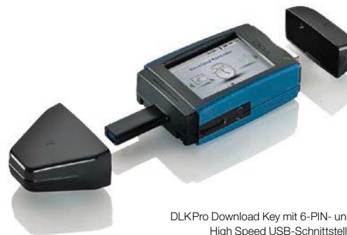
DLK Pro Download Key mit 6-PIN- und High Speed USB-Schnittstelle

Bestell-Nr. DLK Pro Download Key: A2C59514502 Bestell-Nr. DLK Pro Licence Card: A2C59514674 Bestell-Nr. DLK Pro Power Box: A2C59514675 Bestell-Nr. DLK Pro Neoprene Case: A2C59514917